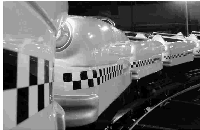
Bild oben: Ruhe vor dem Sturm. Die Taxi-Chaisen warten auf ihre ersten, mutigen Fahrer

Wir gratulieren Herrn Senk zur Investitionsbereitschaft und zur äußerst gelungenen Wiedergeburt dieses Karusselltypes und wünschen ihm viele gute Plätze und begeisterte Fahrgäste.<<<