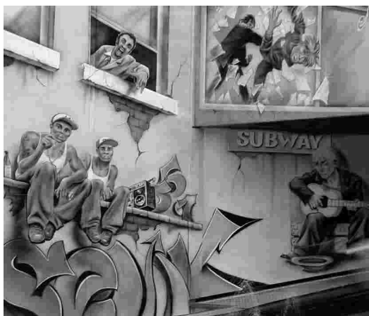
Bilder unten: Impressionen der aufwendigen Fassadenmalerei.