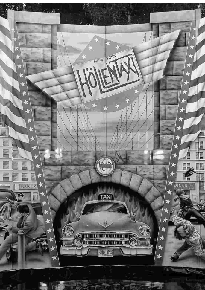
Bilder oben: Das Höllentaxi in Vision und Wirklichkeit.

von Marcus Preis [Text] und Dennis Joswig [Fotos]