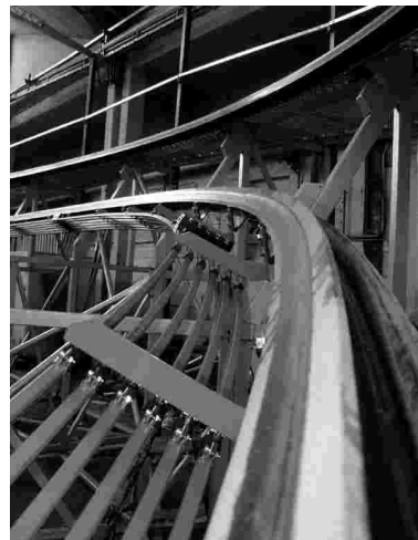
3tes Bild von oben: Hochgeschwindigkeitstrasse für Taxen